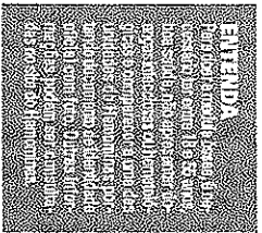
ENCONTRO Depois de a ela publicar nas redes sociais um vídeo da inauguração de uma música de Anita, foi criada a campanha #AnitaLacommunidade pedindo que a cartora ganhasse uma homenagem em vídeo para a menina. O vídeo viralizou e chegou até a cartora, que se sensibilizou e entrou em contato.

Com a publicação dos dois chamamentos, em janeiro, a administração municipal alterou a forma de contratação de serviços de compartilhamento de bicicletas, em relação ao Sistema Bike BH – permitindo a operação por parte de mais de uma empresa e de mais de um sistema, a exemplo do que já está ocorrendo em outras cidades do Brasil e no mundo. A empresa Sertel credenciou-se para prestação de serviços de compartilhamento de bicicletas com estação apenas na orla da Lagoa da Pampulha, propoendo a instalação de 14 estações – oito a mais do que as seis atualmente instaladas. A empresa assinou o novo contrato com a BHTrans em 4 de abril e tem 90 dias para colocar o novo sistema em operação.