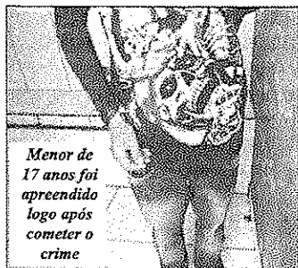
Menor de 17 anos foi apreendido logo após cometer o crime